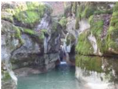
Solution au dos