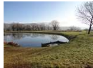
1 er bassin (de décantation)